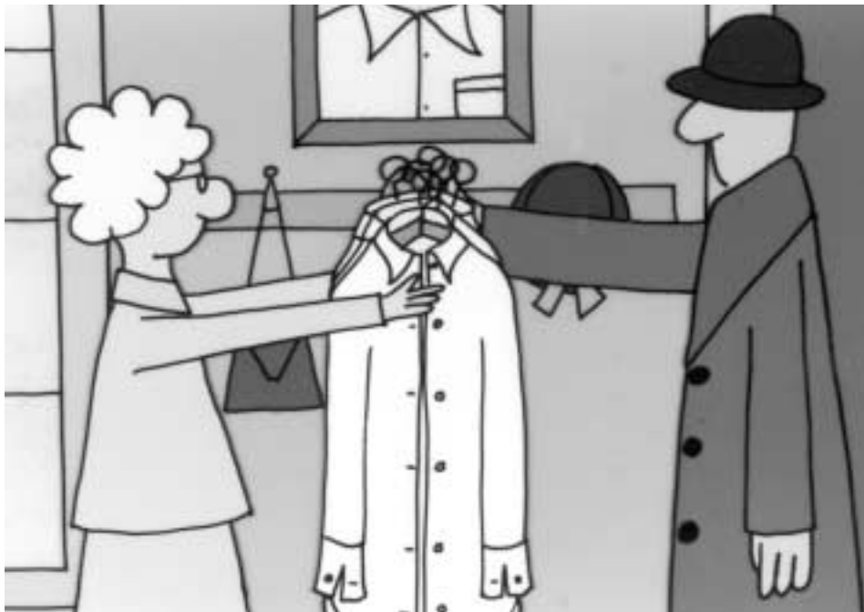
My Grandmother Ironed the King's Shirts

Dans ce film, Torill Kove relate avec imagination la vie et le travail de sa grand-mère à Oslo, en particulier pendant la Deuxième Guerre mondiale. Son histoire entremêle les récits de sa grand-mère et des événements historiques et fictifs.