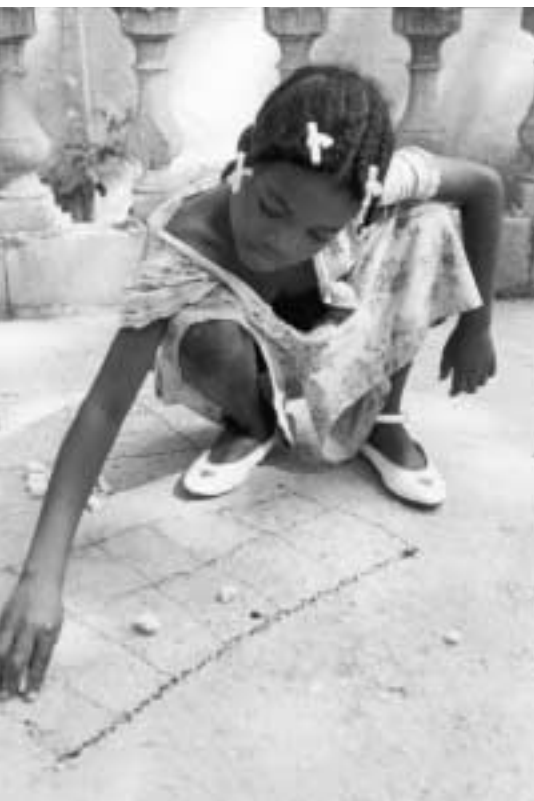
Of Hopscotch and Little Girls