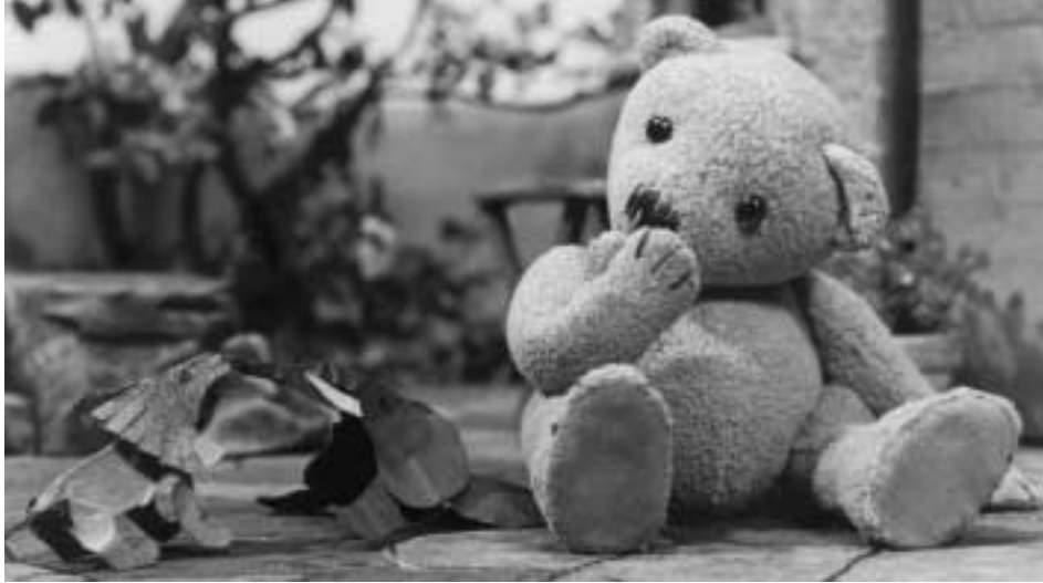
Ludovic – Un crocodile dans mon jardin