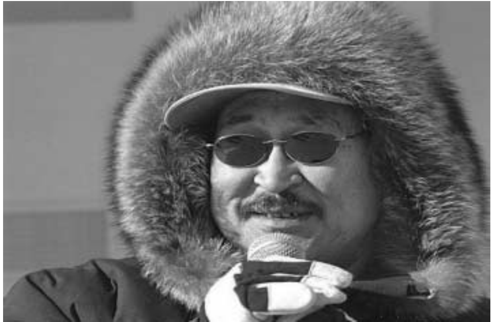
Welcome to Nunavut